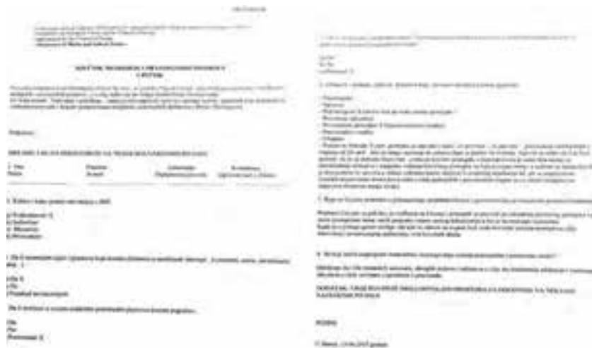
Sl. 1. Upitnik / Pravosuđe - primjer popunjenog upitnika

Intervjue i upitnike smo radili kroz direktne kontakte i sastanke s ispitanicima/cama, ali smo ih slali putem faksa i slanjem e-mailova na adrese svih pravosudnih institucija u Bosni i Hercegovini, svih nivoa (državne, entitetske, općinske, okružne).